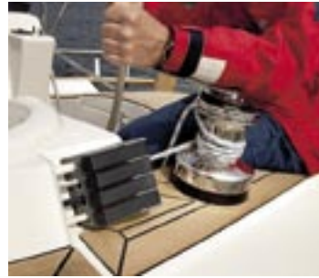
Trimlinor och skot har förts genom sittbrunnssargerna till avlastarna och vinscharna på bägge sidor om sittbrunnen.