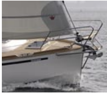
Ankaret hänger väl skyddat under pulpiten/stävstegen. Lägg märke till den i relingslisten infällda knapen.