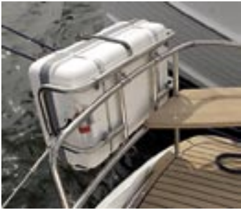
Rejäl akterpulpit med inbyggt fäste för livflotten. Praktiska sittplatser i hörnen.